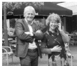
Ot en Len op ouderenreis

"Wat zijn we toch fantastisch hé? Ik ben nog fit van lijf en verstand. Wel wat artrose in mijn heup en mijn knie. Als ik me buk, is het net of ik sterretjes zie. Mijn pols is iets te snel, mijn bloeddruk wat te hoog, maar ik ben nog fantastisch goed... zo op 't oog."